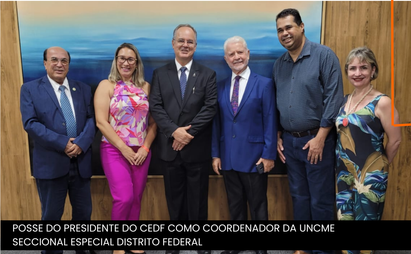
POSSE DO PRESIDENTE DO CEDF COMO COORDENADOR DA UNCME SECCIONAL ESPECIAL DISTRITO FEDERAL